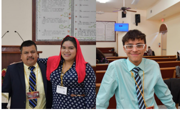
"Alegrate oh Juventud"