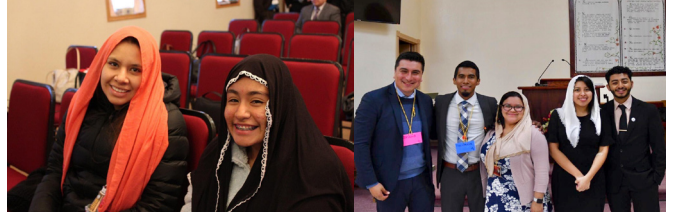
"Oh yo quiero ser un pampano y que Cristo sea la vid"