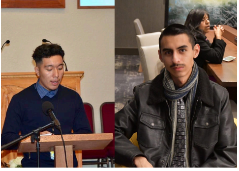
"Dios es Nuestro Amparo y Fortaleza."

"Tu pues sufre trabajos como fiel soldado de JESUCRISTO." 2a Timoteo 2:3