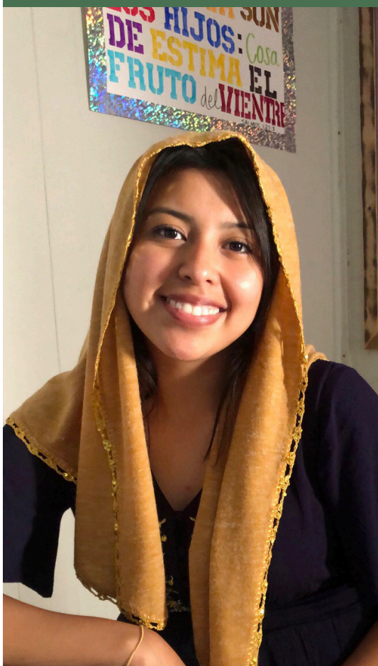
Grand Prairie, TX