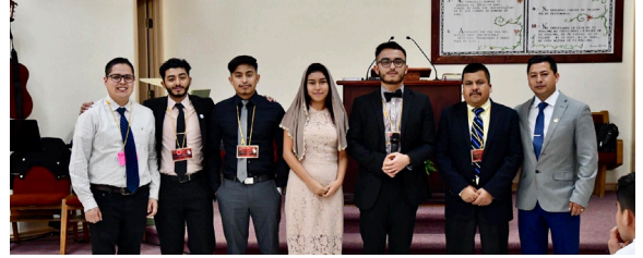
"Juventud Somos esa luz en la tierra ejemplo debemos ser"