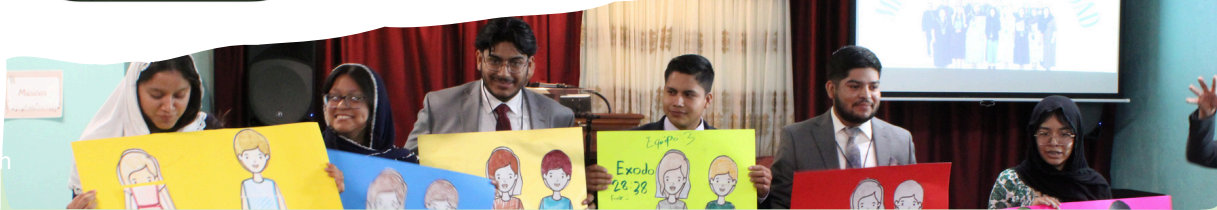
We Are The Youth