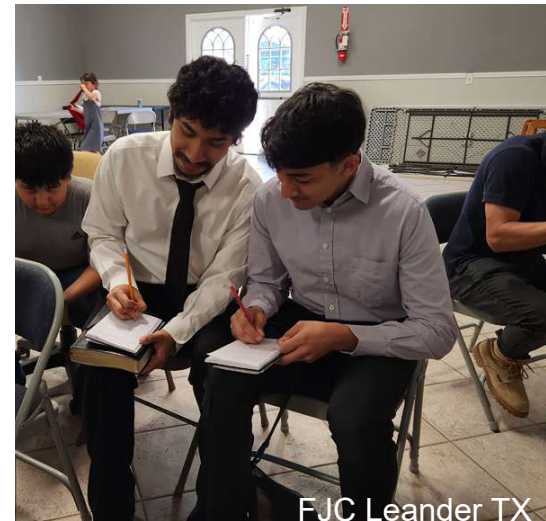
FJC Leander TX

de levadura para que toda la masa fuera leuda (1ª Corintios 5:6). Con ello es que podemos afirmar que no son necesarios sucesos tan “grandes”, basta una “simple distracción” para que seamos desviados de nuestro propósito y que nuestro objetivo sea trastornado. “Entonces los que temen a Jehová hablaron cada uno a su compañero; y Jehová escuchó y oyó, y fué escrito libro de memoria delante de él para los que temen a Jehová, y para los que piensan en su nombre. Y serán para mí especial tesoro, ha dicho Jehová de los ejércitos, en el día que yo tengo de hacer: y perdonarélos como el hombre que perdona á su hijo que le sirve. Entonces os tornaréis, y echaréis de ver la diferencia entre el justo y el malo, entre el que sirve á Dios y el que no le sirve.” Malaquías 3:16-18